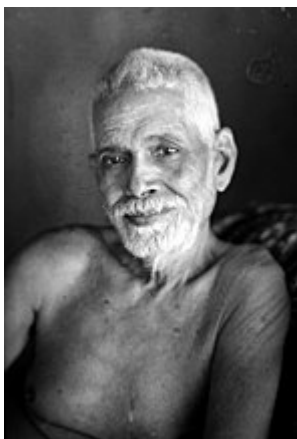
Ramana Maharshi, le sage d'Arunachala

L'Éveil ou l'État d'éveil évoque traditionnellement, dans la philosophie indienne , une libération totale de l' ego (en tant que « moi » commun) pour un retour à sa véritable nature. Selon les courants, les moyens de parvenir à l'éveil diffèrent. Par exemple, il existe plusieurs formes de yoga .