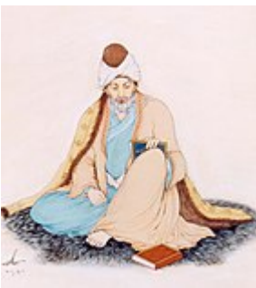
Djalâl ad-Dîn Rûmî, poète mystique du soufisme

Pour le soufisme , l'éveil spirituel représente une seconde naissance qui nécessite, comme le dit un hadith de « mourir avant de mourir » [8] , car comme le dit le cheikh Arslân (mort vers 1160) : « Tu es un voile pour toi-même / Dieu ne t'est donc voilâ que par ton ego » [9] . Il s'agit donc pour l'ego de s'éteindre dans l'Unicité divine ( arabe : al-fanâ' fi l-tawhîd ). Mais celui qui a brûlé ses qualités individuelles pour s'anéantir va désormais subsister ( baqâ' ) en Dieu [9] . On