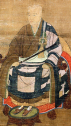
Eisai, fondateur de l'école rinzai au Japon

Sur la voie du zen , l'Éveil peut être compris comme pouvant survenir brusquement , et même brutalement (voir courant zen Rinzai , révélations d'ordre mystique). Hermann Hesse , parlant de l'éveil du zen dans une lettre écrite à un ami, donne cette définition de l'éveil : « atteindre cet éveil, cette union avec la totalité , non de manière intellectualisée mais en la vivant comme une réalité avec l'âme et le corps, devenir cette unité , voilà le but auquel aspirent tous les disciples du Zen » [7] .